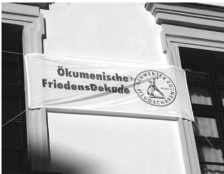
Transparent: Ökumenische Friedensdekade

In dieser Zeit beginnt er mit seinen Arbeiten an der Ethik. Während die traditionelle lutherische Lehre von den zwei Bereichen Gottes ausgeht, das Reich Gottes und das Reich der Welt also in der Weise trennt, dass in ihnen unterschiedliche Verhaltensregeln gelten, tritt Bonhoeffer für das »unteilbare Ganze der Gotteswirklichkeit« ein, die in Christus offenbart ist. Christen haben Anteil an dieser Christus-Wirklichkeit und können diese in keinem Bereich ihres Lebens ausblenden. Gerade auch in politischen Entscheidungen muss sich das bewähren. Damit stellt er die traditionelle Rechtferti-