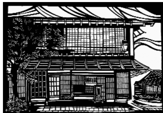
Ein Druck von Gen Tsuboi, Japan

Wer für die Ausstellung »In God's Image« interessiert, aber dafür nicht nach Kanada reisen kann oder will, dem sei das gleichnamige Buch zur Ausstellung empfohlen, in dem sich Kunstwerke, Fotografien und die englischsprachigen Texte der Ausstellung auf 144 großflächigen Farbseiten finden. Das Buch kann über die Weltkonferenz, die Mennonitische Universität Kanada in Winnipeg oder den Buchhandel (ISBN: 978-0836192544) bezogen werden.