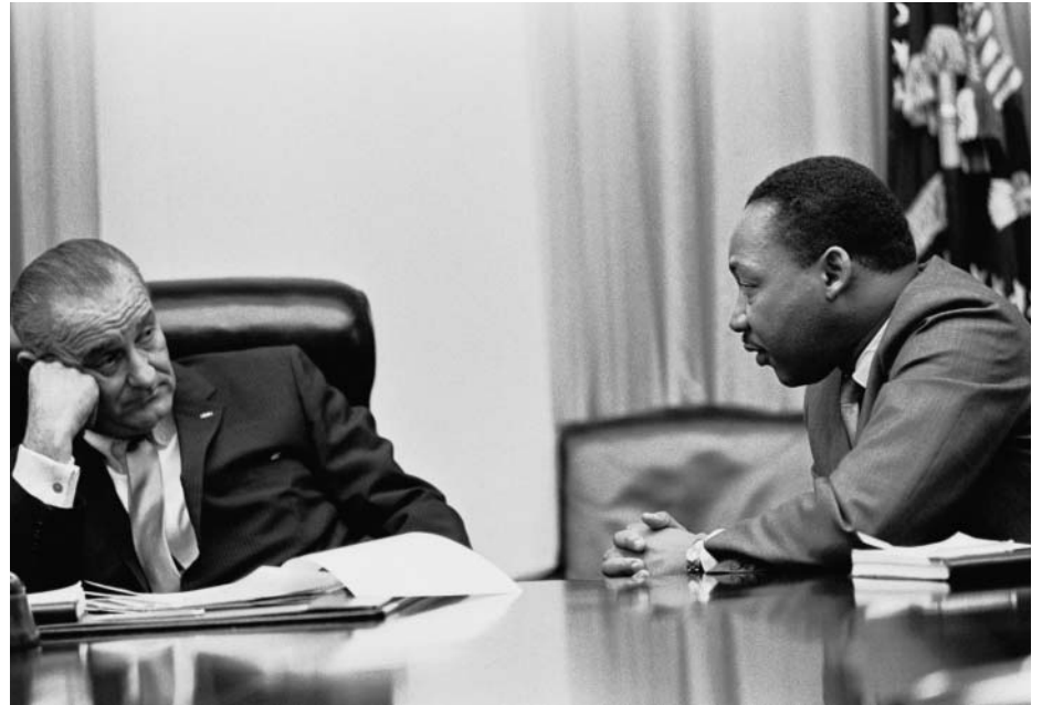
Martin Luther King(r) im Gespräch mit dem amerikanischen Präsident Lyndon B. Johnson (März 1966)

Kurz vor dem geplanten Beginn der Kampagne der Armen kam es im März 1968 in Memphis / Tennessee zu einem Arbeitskampf der überwiegend afro-amerikanischen städtischen Kanal- und Müllabfuhrarbeiter. Hungerlöhne, menschenunwürdige Arbeitsbedingungen und rassistische Willkür im Umgang mit ihnen hatten sie dazu gebracht. Bei ihren Protestmärschen durch die Stadt trugen sie große Brust- und Rückenschilder mit der Aufschrift: »I AM A MAN« (»Ich bin ein Mensch«). Die Polizei griff immer wieder mit Schlagstöcken dazwischen, und die Stadtverwaltung von Memphis weigerte sich nicht nur, mit ihnen zu verhandeln – sie waren nicht gewerkschaftlich organisiert –, sondern erwirkte gerichtlich ein Verbot weiterer Protestmärsche. King, der ihr Leiden beispielhaft für die Lage aller Armen in den USA fand, war von der Notwendigkeit überzeugt, zusammen mit diesen Armen in Memphis das Recht auf Protestmärsche und eine menschenwürdige Behandlung durchsetzen zu müssen. Bei einem ersten großen Protestmarsch, am 28. März 1968, kam es in der angespannten Situation zu Randalen, die sofort massive Repression seitens der Polizei bewirkten. Niedergeschlagen durch die Gewaltausbrüche flog King wieder nach Atlanta zurück; am 3. April kam er mit seinem Team wieder nach Memphis um einen zweiten gewaltfreien Protestmarsch mit den Müll- und Kanalarbeitern vorzubereiten. Am 4. April wurden mit den Mitarbeitern