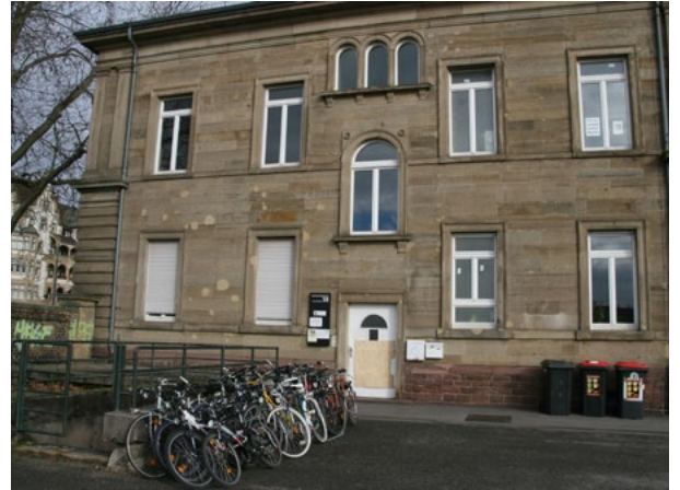
▲ Das MRZ im Alten Schlachthof in Durlach

Als Hauptmieter hatte der Verein „Menschenrechtsverein im MRZ“ dieses Haus von der Stadt Karlsruhe gemietet und dann an uns, die einzelnen Vereine untervermietet. Doch in den letzten Jahren wurde es wohl für den Verein immer schwieriger die anfallenden Aufgaben (Nebenkostenabrechnungen, Mietanpassungen, Kontakt zur Besitzerin) zu erfüllen. Auch gab es wohl schon seit einigen Jahren keine ordentliche Mitgliederversammlung mehr und eigentlich war der Vorstand nicht mehr handlungsfähig. Als im Sommer 2025 die Stadt als Vermieterin die Notbremse zog (nach ernststen Mahnungen und Stromabschaltungen wegen unbezahlter Rechnungen), war die erste Idee von allen beteiligten Vereinen, den „Menschenrechtsverein im MRZ“ zu stärken und neu zu beleben. Doch es stellte sich nach etlichen Treffen, auch mit den zuständigen Stellen der Stadt Karlsruhe, heraus, dass dieses Vorhaben zum Scheitern verurteilt war. Daraufhin haben wir als NutzerInnen den neuen Verein „Haus der Menschen-